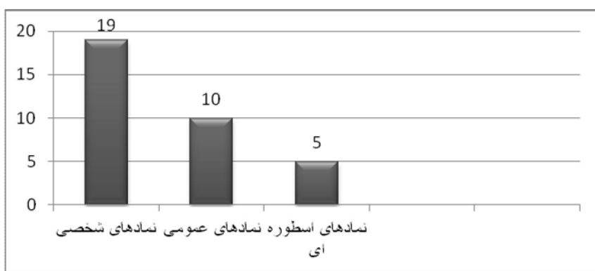
نمودار توزیع فراوانی نمادهای شعری اخوان ثالث در دهه سی